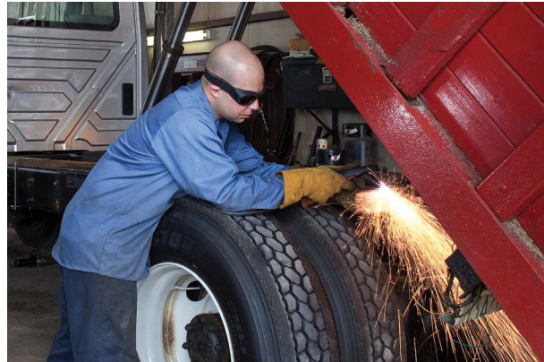
Reparación y modificación de vehículos