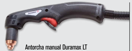
Antorcha manual Duramax LT