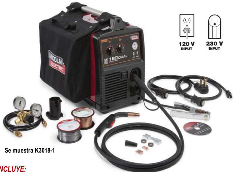
Se muestra K3018-1